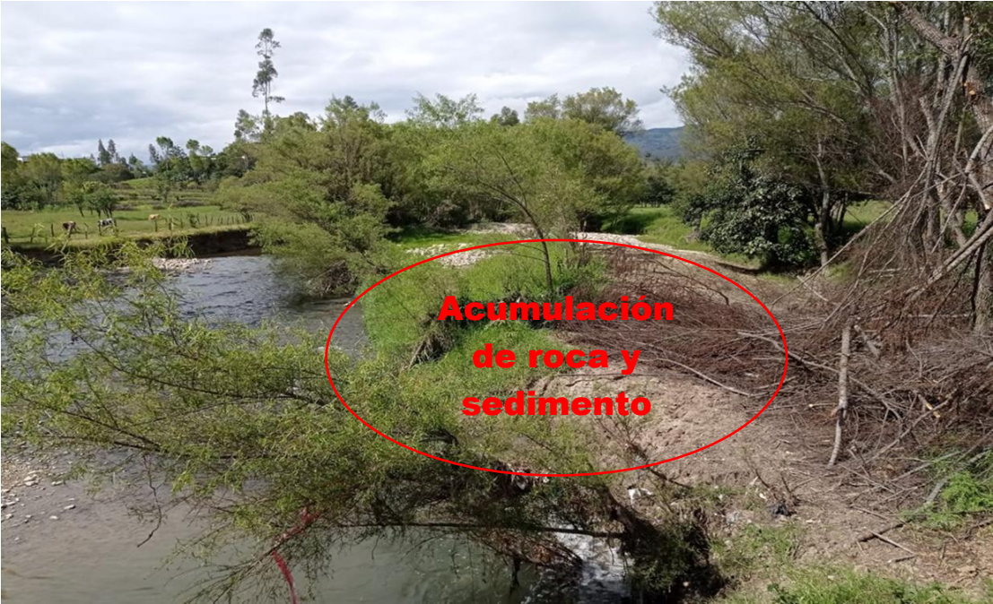
FOTOGRAFIA N°02: MATERIAL COLMATADO EN EL CAUCE DE LA QUEBRADA SAN MIGUEL (RIO CHOTANO).